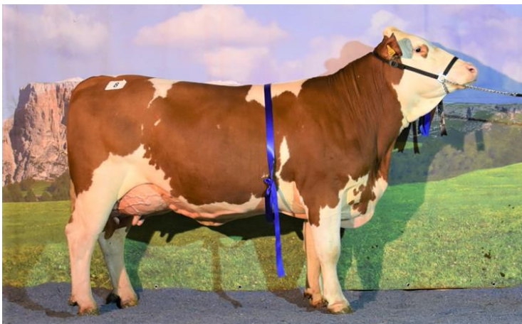
Mutter/Madre - REMMEL BG-Bonanza