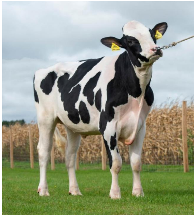
Der wohl beliebteste Holsteinstier der Welt Farnear Delta-Lambda