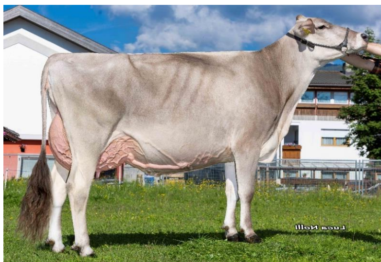
Gastello Gelse, die Halbschwester von Gala Gastello Gelse, la sorellastra di Gala

Questa manza gravida di Barca deriva da una figlia di Falco, che spicca con una lattazione oltre 11.000 kg di latte e una buona punteggiatura. Da sottolineare in questa famiglia sono i titoli di grasso e proteina molto alti. Molto interessante è anche la gravidanza con Clint-sessato, un toro eccellente per la morfologia.