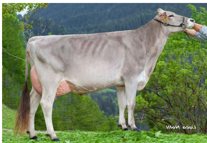
Großmutter/nonna, Nonstop Niagara

Questi ebrioni di Danger S offrono la possibilità di investire in una linea eccezionalmente completa con vacche forti non solo a produzione, ma anche a morfologia. Derivano della madre Jongleur Jean EX92/90, della nonna Nonstop Niagara VG89/88 e della bisbisnonna Collection Corella EX95/98. Queste vacche hanno partecipato con successo a diverse mostre.